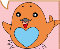
奈良弁護士会 公式キャラクター こまちゃん